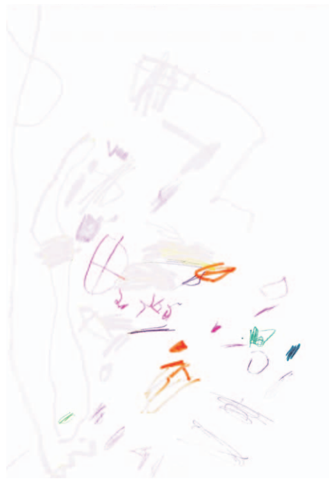
Sofie Værø (4) er kunstneren bak denne tegningen.