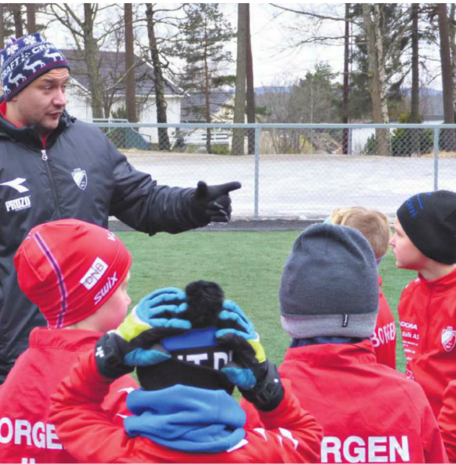
Trener for Borgen ILs unge, som her i klubbens fotball-SFO.