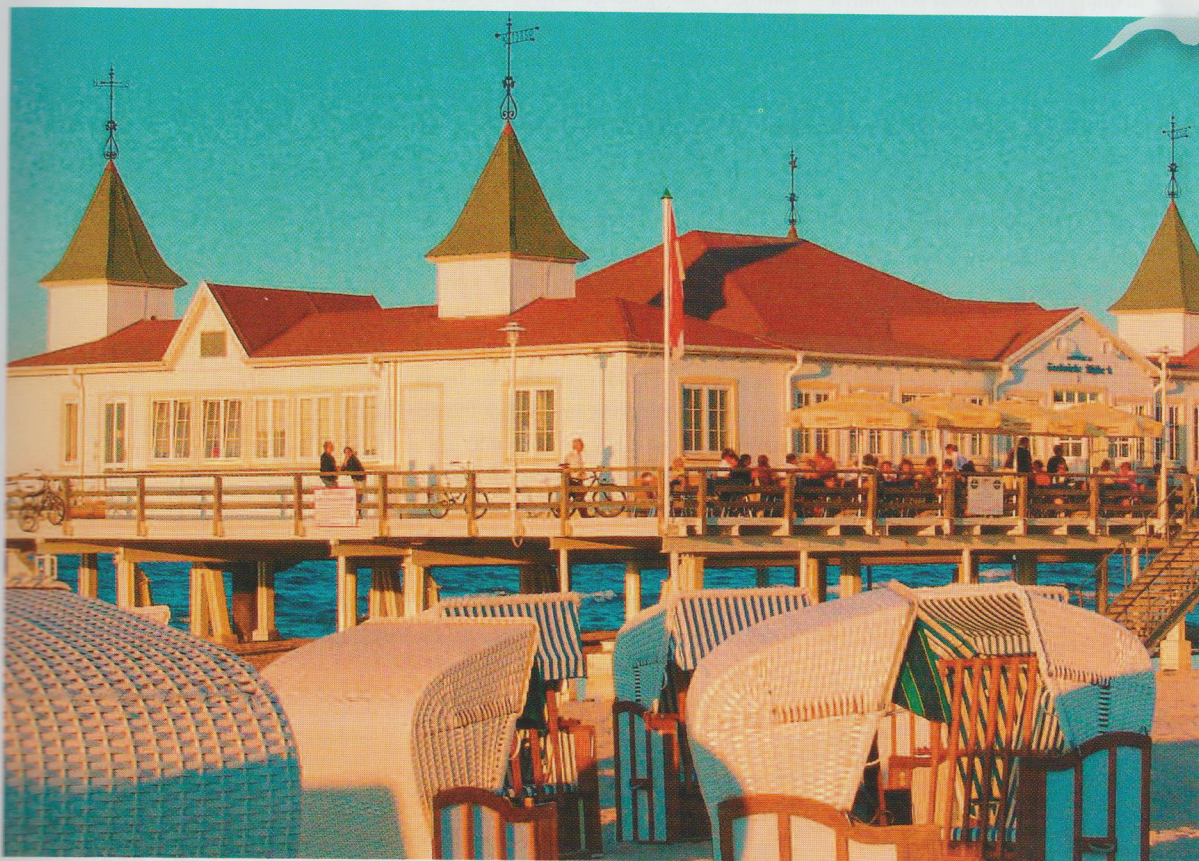
Ahlbeck Seebrücke med de karakteristiske strandstolene i forgrunnen som kan leies for ca. 5 euro pr. dag.

Byene Ahlbeck, Heringsdorf og Bansin kall henspiller til keisertiden da et opphold her ble ansett for å ha helbredende virkning på kropp og sjel. I disse byene er det ofte festivaler, og her er noe for enhver smak i løpet av året. Først og fremst er det musikk- og kulturbegivenheter, men også arrangementer for mote og design, der de historiske bygningene står i sentrum for begivenhetene.