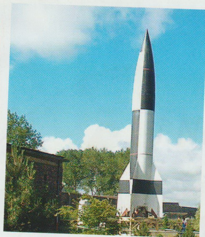
V2-raketten terroriserte London under den andre verdenskrig, men la også grunnlaget for USAs romfartsprogram under ledelse av Werner von Braun.