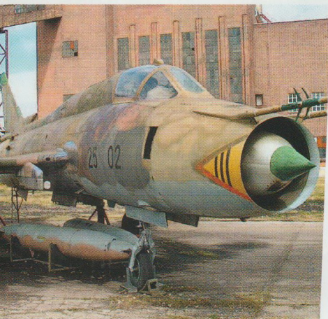
I Peenemündes gamle kraftverk ligger det tekniske muséet som også har en stor utstilling med fly fra tiden bak Jernteppet. I forgrunnen et Mig-21 jagerfly.