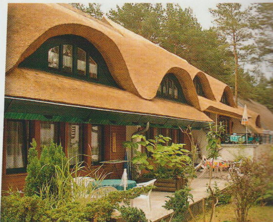
Har man hverken bil eller campingvogn, er det gode muligheter for leiligheter eller rom på de fleste plasser, som f.eks i slike eventyrhus hos Dünenecamp, campingplassen med 5 stjerner ved Karlshagen.