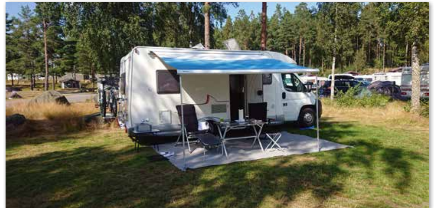
Skara Sommarlandcamping tilbyr romslige plasser for bobiler.

Det er heller ikke langt (12 km) til Hornborgasjøen hvor den