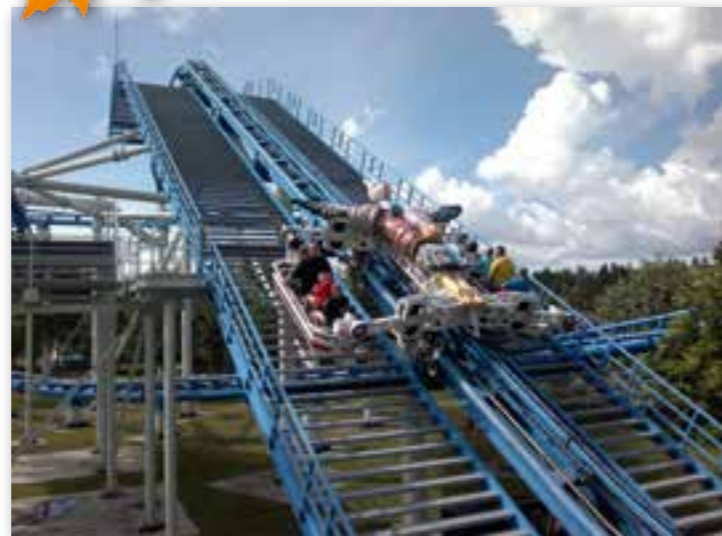
Tranen er en attraksjon i Skara Sommarland, som gjenspeiler tranenes aktiviteter ved Hornborgasjøen.