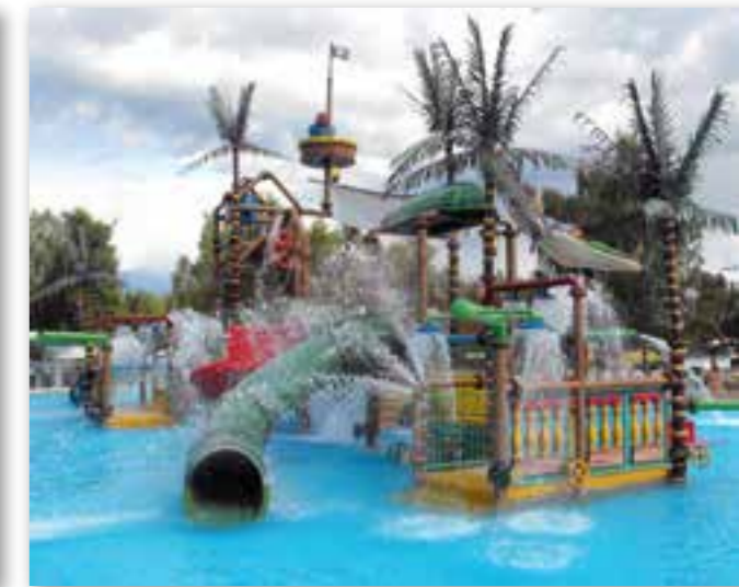
Mange muligheter i Skara Sommarlands bassenger.