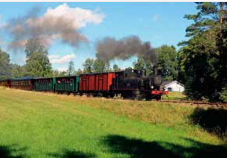
Smalsporet museumsjernbane mellom Skara og Lundsbrunn.