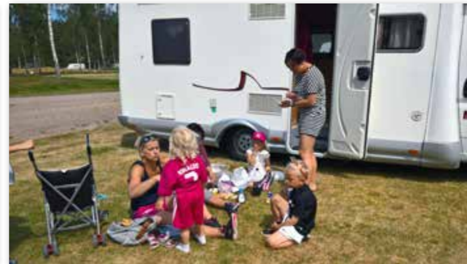
Bobilen er en fin base enten det er fotballturnering eller lek i Sommarland, som fenger.