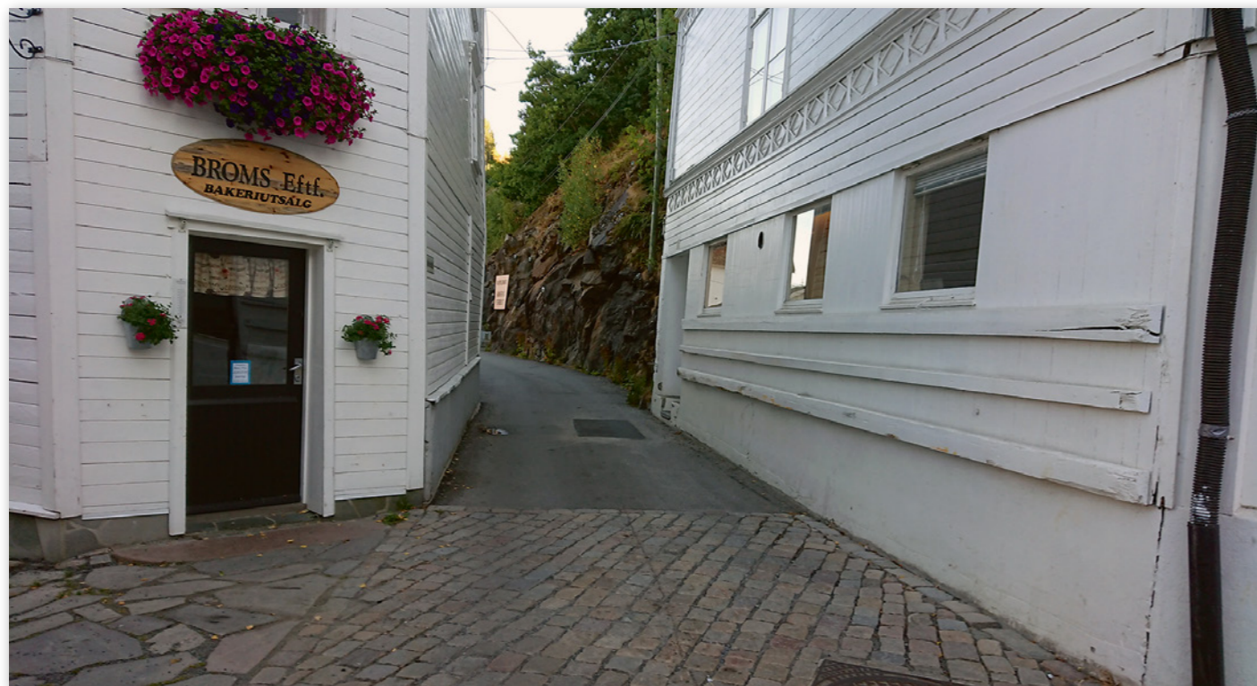
Bakkeskåt i Tvedestrand er den trange innkjøringen til bobilplassen på brygga. Der innenfor Broms bakeri lå bussholdeplassen i sin tid. Om busser kom seg inn her, burde vi vel saktens klare det også. Broms rundstykker kan anbefales.

Olav II Haraldson (senere "den Hellige") flyktet fra sine fiender mot land, der en liten kløft i fjellet åpnet seg til å bli en seilbar led for kongens skip, mens et skjær (som nå kalles Trollkjær-ringa) plutselig dukket opp i sundet, som Olavs forfølger gikk på og forliste ved.