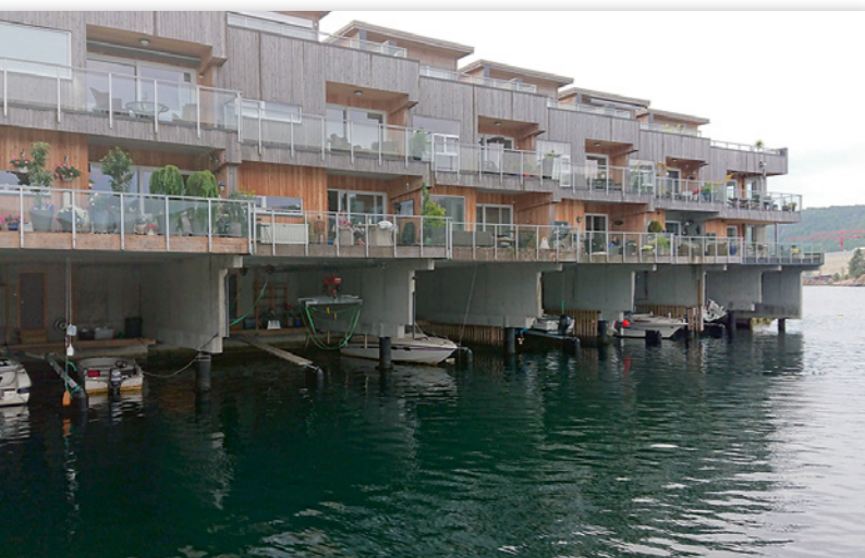
Naust i stedet for garasjer i leilighetskomplekset tett ved bobilplassen i Flekkefjord.

å seile med vikingskip gjennom Lindesneshalvøya for å unngå det værharde Lindesneset, noe småbåter fortsatt kan utnytte. Vår informasjon tilsa at det skulle være en bobilparkering ved kanalen, men ved ankomst viste den seg å være stengt og nedlagt. Derfor ble det en sen lunch ved kanalen med slækking solveggen, innen vi bestemte oss for å legge turen mot Lyngdal og campingplassen der, innen det ble for sent. Om veien hadde vært smal ut til Spangereid, så ble den ikke særlig bredere mot