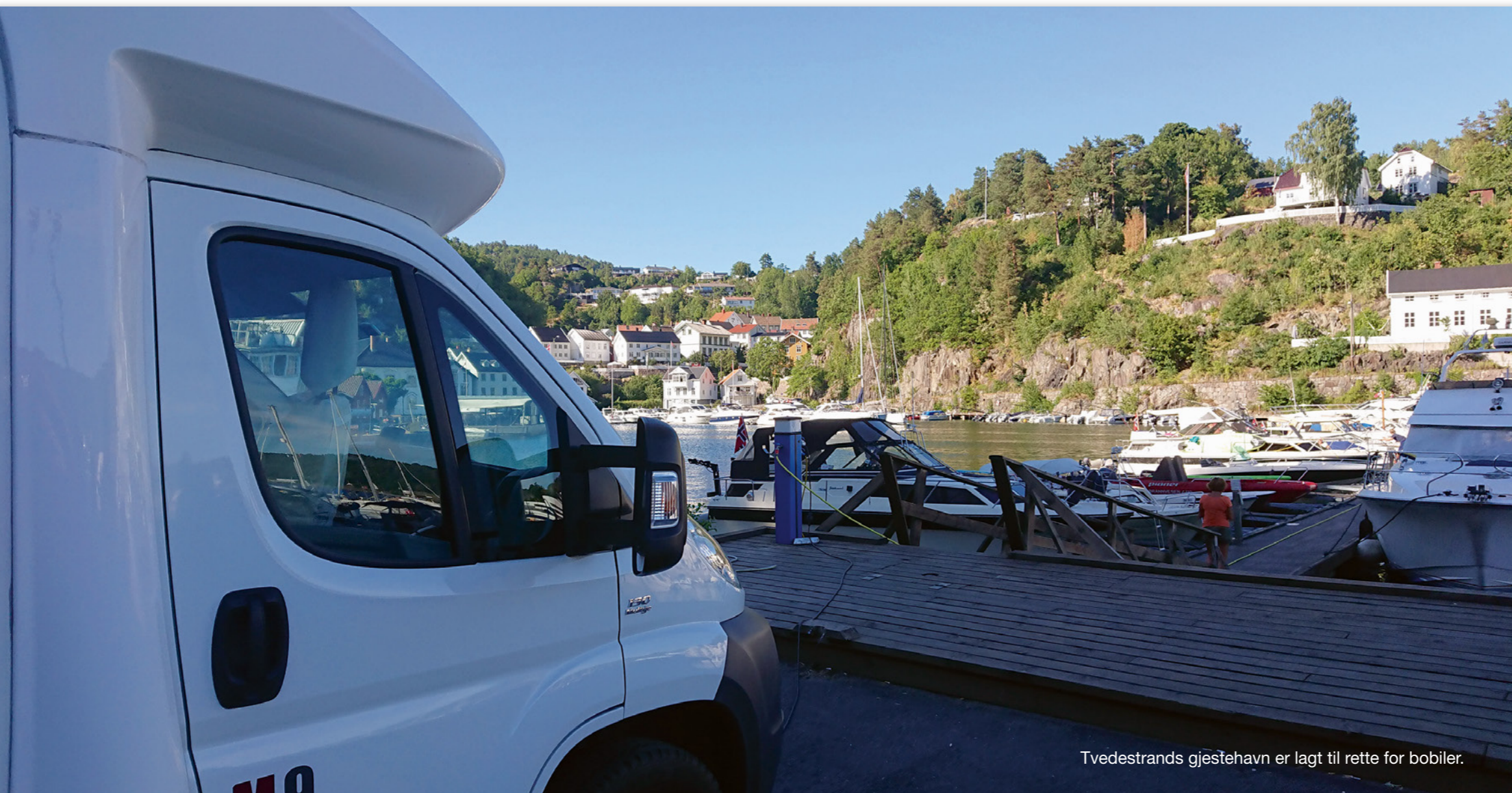
Tvedestrand's gjestehavn er lagt til rette for bobiler.

– Det blir dyrt, var kommentarene da vi ytre ønske om å legge sommerturen langs Sørlandskysten for noen år siden. - Nåvel, tenkte vi, - den samme innvendingen fikk vi innen turen til Nord-Norge også. "Det blir dyrt og langt", var omkvedet den gangen. Ja, langt ble det, men ikke så dyrt som advarslene lød. - Skeptikerne får nok rett nå som planen er å "gjøre" Sørlandet nærmest midt i fellesferien, måtte vi stilltiende medgi.