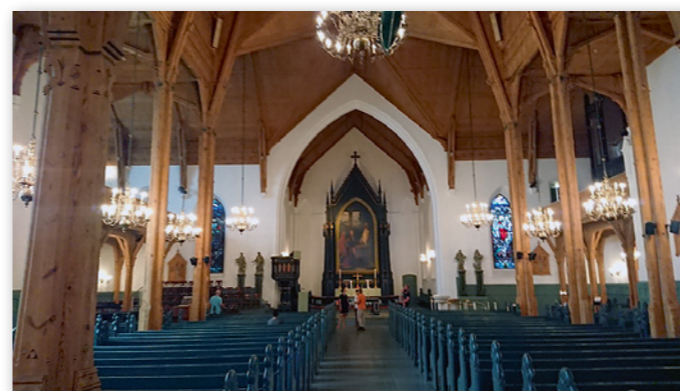
Domkirken i Kristiansand er et flott skue.