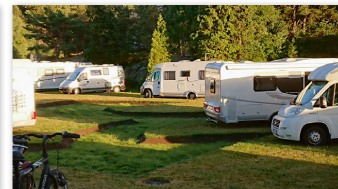
Uvant plassinndeling på Odderøya i Kristiansand.

Kristiansand så tidlig som mulig. På asfalten ut mot Bendiksbukta var det fullt, så vi valgte gressplassen opp mot Odderøya fort, hvor avgrensningene mellom bobilene var markert med grøfter. Litt uvant, men funksjonelt med tanke på sikkerhetsavstander.