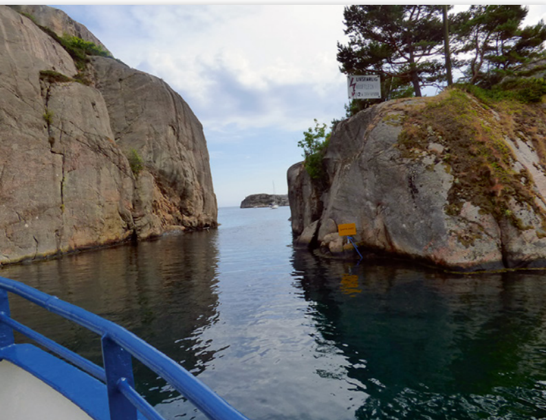
Olavsundet utenfor Søgne og Åros camping åpnet seg for kong Olav da han flyktet fra fiendene sine.