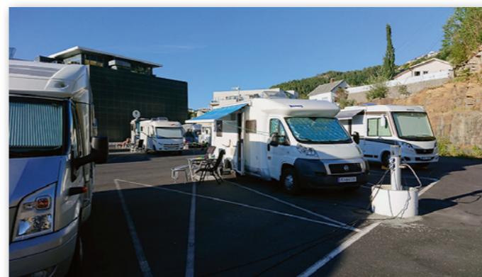
Flekkefjords bobilplass ligger fint til nær sentrum, og har funksjonelle serviceopplegg.