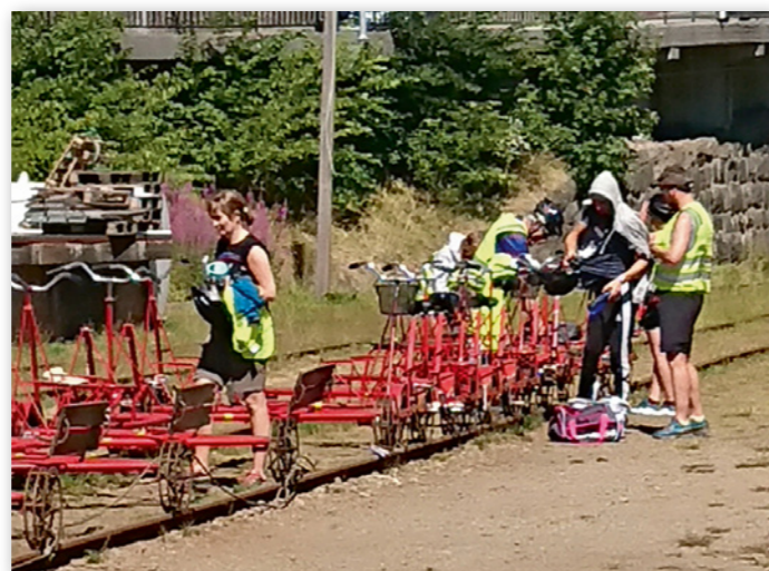
Dresinsykling er mulig fra Flekkefjord sentrum.