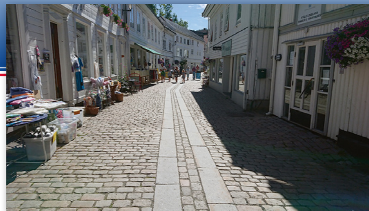
Hyggelig gågate i Tvedestrand byr på gode handlemuligheter.