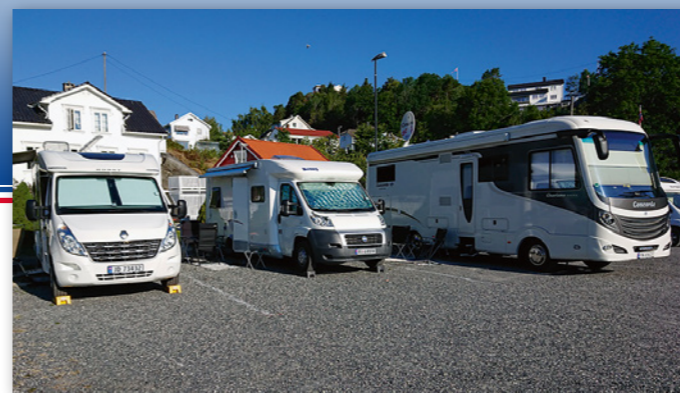
Risør har lagt forholdene til rette for bobilgjester.