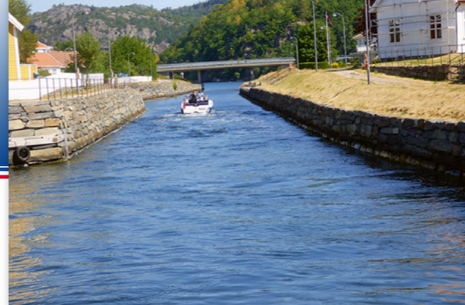
Sprangereidkanalen slik den fremstår etter "gjenåpningen" i 2007. I vår tid er det langt mellom vikingskipene riktignok.

Lyngdal. – Blir det smalere nå, er betegnelsen sykkelsti, utbrøt fruene som rattet bobilen frem mellom skrenter og stup. Vel fremme var campingplassen full. Samtidig fant vi ut at det ville vært mulig å fricampe ved Lindesnes fyr, ute i havgapet, men vi var overmette på smale veier for i dag, så vi fortsatte mot Flekkefjord.