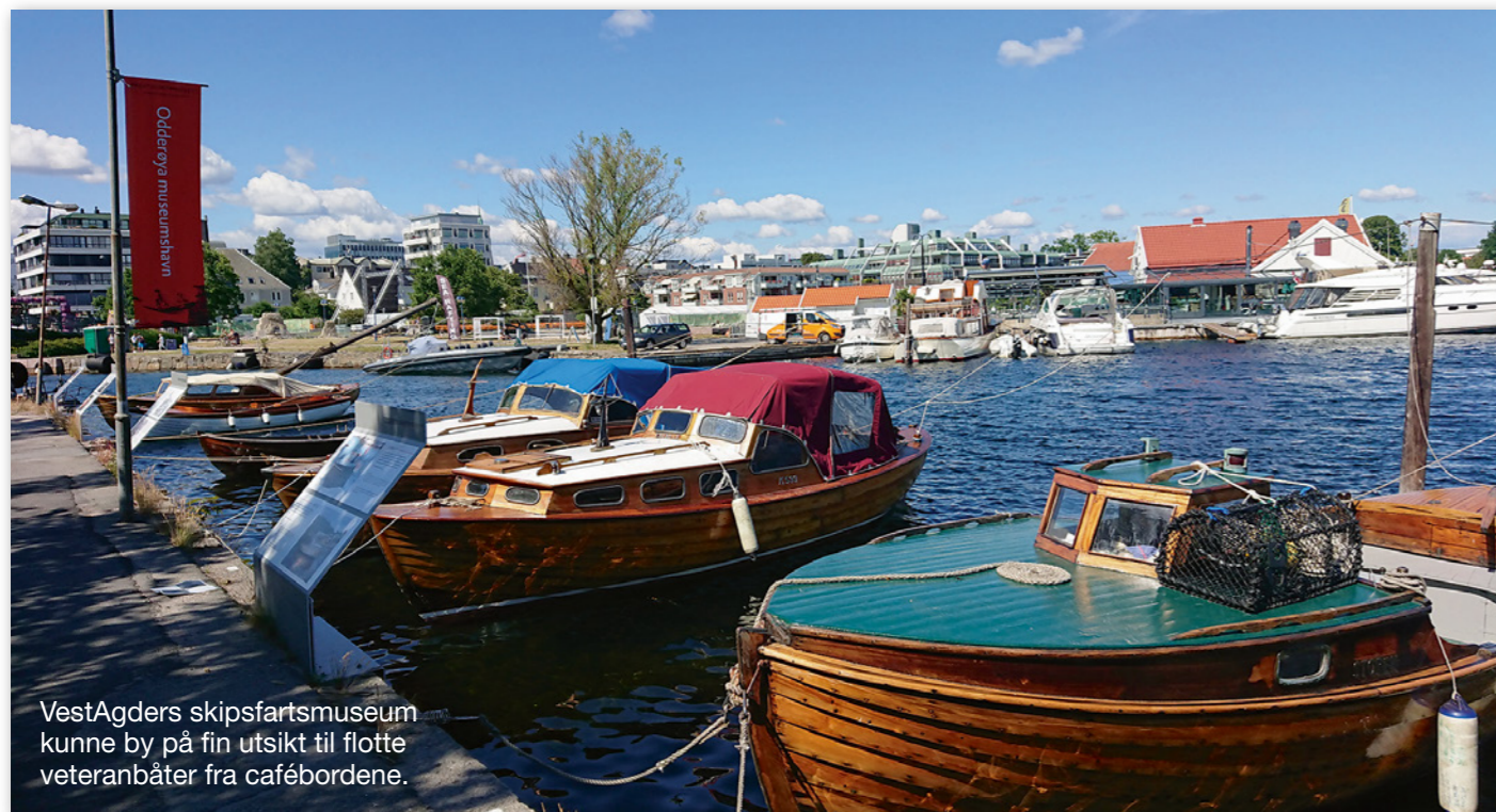
VestAgders skipsfartsmuseum kunne by på fin utsikt til flotte veteranbåter fra cafébordene.

Selv om vi mente at vi hadde pakket mye og variert før turen, så er det enkelte favorittplagg som trenger en vask etter noen dager. Følgelig bestemte vi oss for Åros camping i Søgne neste dag. Derfra hadde fruene gode minner med døtrene under en campingtur på 90-tallet. Vi fikk kjørt noen maskinvasker og dusjet uten tanke på vannforbruket. Dessuten ble vi med på båtturen ut gjennom Olavsundet via Ny Hellesund, mens vi fikk repetert sagnet om dette trange sundets tilblivelse: Kong