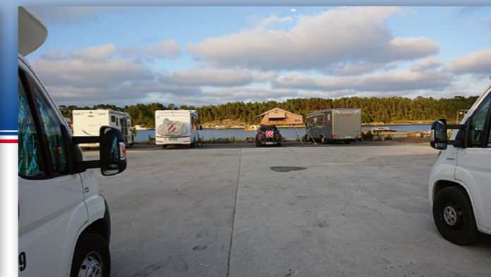
Smietangen i Langesund ligger fint mot leden til danskebåtene.