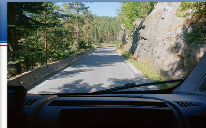
Sykelsti uten midtstripe, må betegnelsen bli om det blir smalere nå.