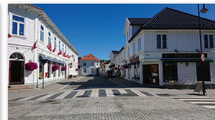
Hollenderbyen i Flekkefjord.