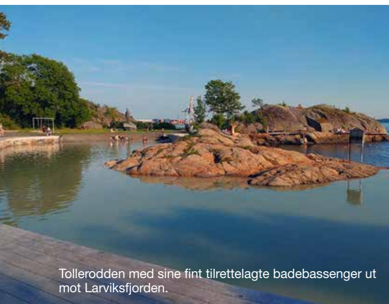
Tollerodden med sine fint tilrettelagte badebassenger ut mot Larviksfjorden.