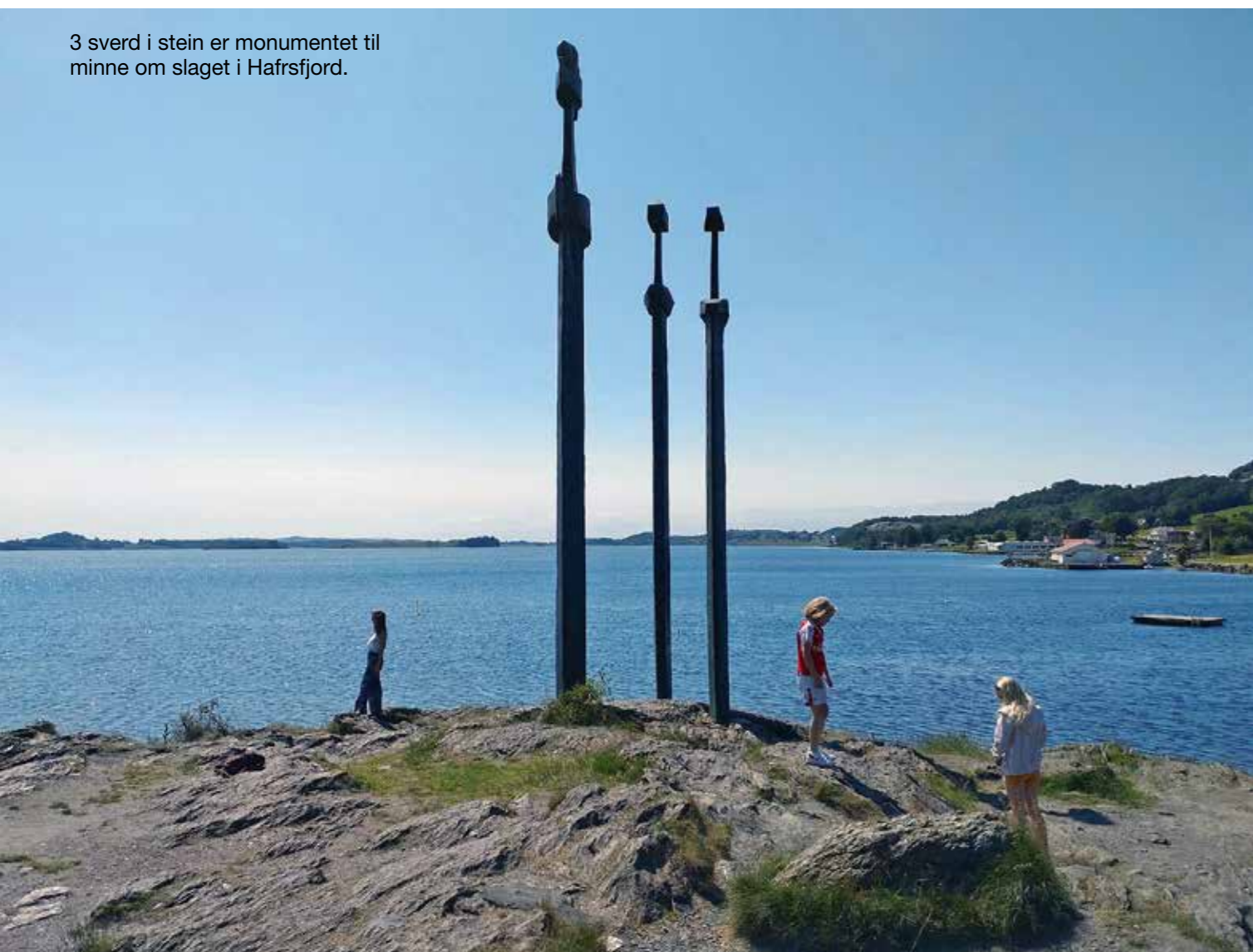
3 sverd i stein er monumentet til minne om slaget i Hafrsfjord.

Den sentrumsnære campingplassen ble en super base for sightseeing i Stavanger-området som har stått så sentralt i Norges historie. Noe den serviceinnstilte og kunnskapsrike damen på turistkontoret velvilligst formidlet til oss, så snart vi hadde parkert bobilen på bryggekanalen like ved. Hun anbefalte oljemuseet en rask spasertur unna, samt en båttur til "Flor &