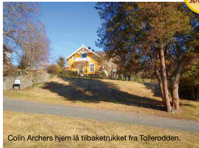
Colin Archers hjem lå tilbaketrasket fra Tollerodden.