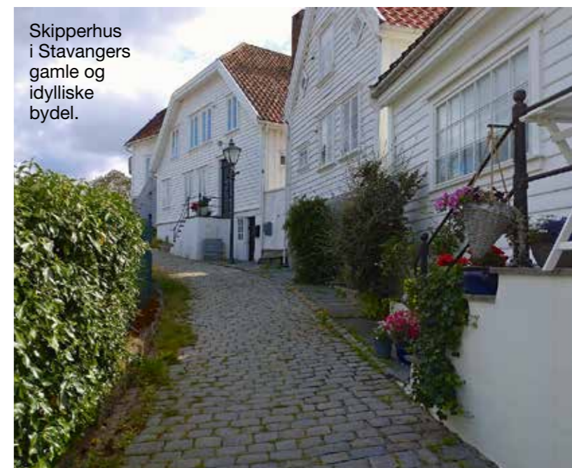
Skipperhus i Stavangers gamle og idylliske bydel.