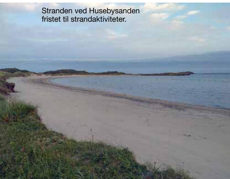
Stranden ved Husebysanden fristet til strandaktiviteter.