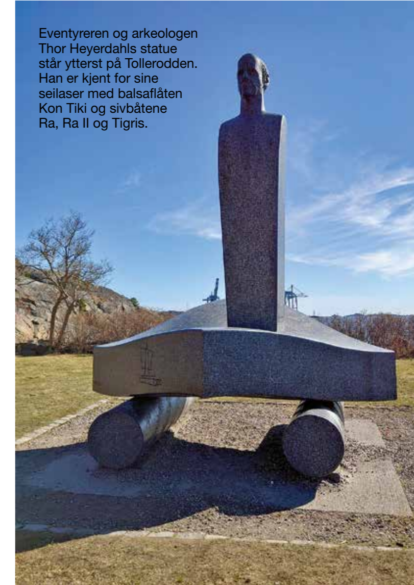
Eventyreren og arkeologen Thor Heyerdahls statue står ytterst på Tollerodden. Han er kjent for sine seilaser med balsaflåten Kon Tiki og sivbåtene Ra, Ra II og Tigris.