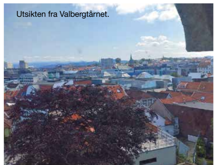
Utsikten fra Valbergtårnet.