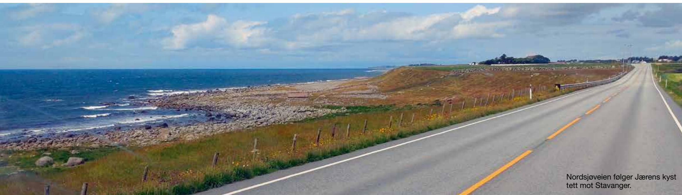
Nordsjøveien følger Jærens kyst tett mot Stavanger.

Mandal i et håp om å sikre oss en plass på bobilparkeringen der. Om det var vår ukyndighet med gps-en eller dårlig skilting som gjorde at vi ikke fant den, kan sikkert diskuteres. Vi ombestemte oss for Farsund, hvor den nye bobilplassen var smekk full. Noe også Lomsesanden camping var, for der kunne telefonvakta fortelle at de hadde avvist over 40 ekvipasjer i løpet av ettermiddagen. Til og med parkeringen utenfor var overfylt, opplyste hun. Vi var allerede på vei utover Losveien da vi ringte, og oppdaget plutselig en fin mulighet for fricamping ved Husebysanden, hvor vi ganske snart fikk flere bobilnaboer. Duften av salt sjø, tang og tare gjorde at vi ruslet ut mot havet i et klittlandskap som minner litt om Nord-Jylland, og fant en eventyrlig badestrand innenfor noen holmer som dempet Nordsjøens bølgebrus. Et riktig så idyllisk område som fristet oss til å bli enda en natt. Noe Allemannsretten gir muligheten til, men en overfylt toa signaliserte at dette ikke var tilrådelig. Da jeg studerte kartet for veien videre, oppdaget jeg at Lista surfing med sin surfcamp lå i Tarevika noen