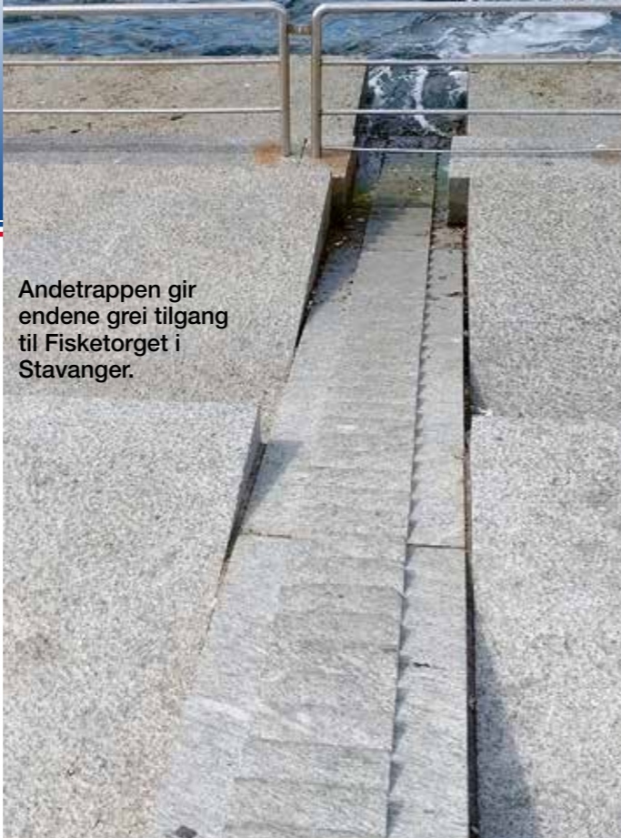
Andetrappen gir endene grei tilgang til Fisketorget i Stavanger.

hundre meter vest for oss. Min tidligere erfaring med windsurfing tilsa at her var forholdene ideelle for slike aktiviteter, men vi skulle videre langs "Nordsjøveien" mot Stavanger.