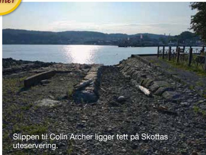
Slippen til Colin Archer ligger tett på Skottas uteservering.

Fjære”, men der var de fullbooket ut juli måned. Den tiden hadde ikke vi til rådighet, så hun foreslo en vandring i den idylliske gamle bydelen i skrenten tett på havnen. Vi la dessuten turen om sentrum hvor vi kunne betrakte Domkirken som Sigurd Jorsalfar fikk bygget i 1125. Kirken var under restaurering og dessverre stengt for skuelystne. Derfra fortsatte vi til de hyggelige gågatene i byens eldre bebyggelse, hvor mange butikker fristet med sine tilbud som førte til grove innhugg i lommeboka. Vi gikk også opp til Valbergtårnet som ligger på en høyde over havnen med en informativ utsikt mot byens skyline. Vår flanering gjennom byparken som omkranser Breiavatnet bød på et yrende fugleliv, innen vi bevilget oss en lunch ved Fisketorget, hvor vi kunne observere byens pulserende folkeliv.