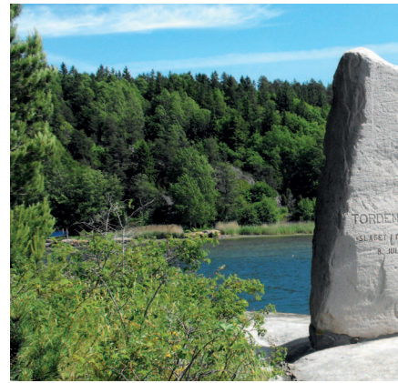
MINNESTØTTE: Her ved minnestøtten i Dynekilens hedret.

– Feiringen innledes i Skjærhallen 8.juli. Derfra seiler flere fartøy deriblant et av