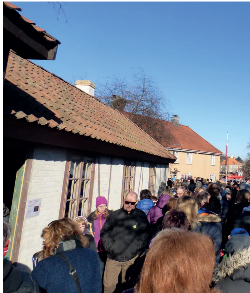
ANNO: Håpet er at det vil komme like mange mennesker til Tordenskioldjubileet som det g

– Tordenskiold oppholdt seg ofte i Fredrikstad og på Isegran. Mange av hans brev er sendt herfra, og selv om flere av dem nok ble utformet i sjefskahytten på skipet så kan det ikke herske tvil om at Tordenskiold gikk på land i Fredrikstad ved flere anledninger. Selv om det ikke finnes dokumentasjon på at han leide seg husrom slik han gjorde i København, vil en lederskikkelse som Tordenskiold helt sikkert ha vært på land og i full vigør med å sørge for proviantering samt kuler og krutt til sine skip og mannskap. I tillegg var det behov for kyndige håndverkere til reparasjon og vedlikehold av skipene. Da måtte han på land for å kunne vurdere deres kvalifikasjoner før de ble hyret. Så det er hevet