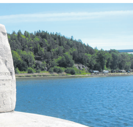
kilen vil alle som falt i slaget den 8.juli i 1716 bli