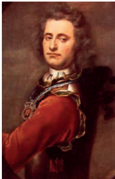
TORDENSKIOLD: Dette er det mest kjente portrettet av Tordenskiold som blir benyttet på danske fyrstikkesker.

Ifølge Sæther har Tordenskiolds forbindelse med Fredrikstad mer eller mindre