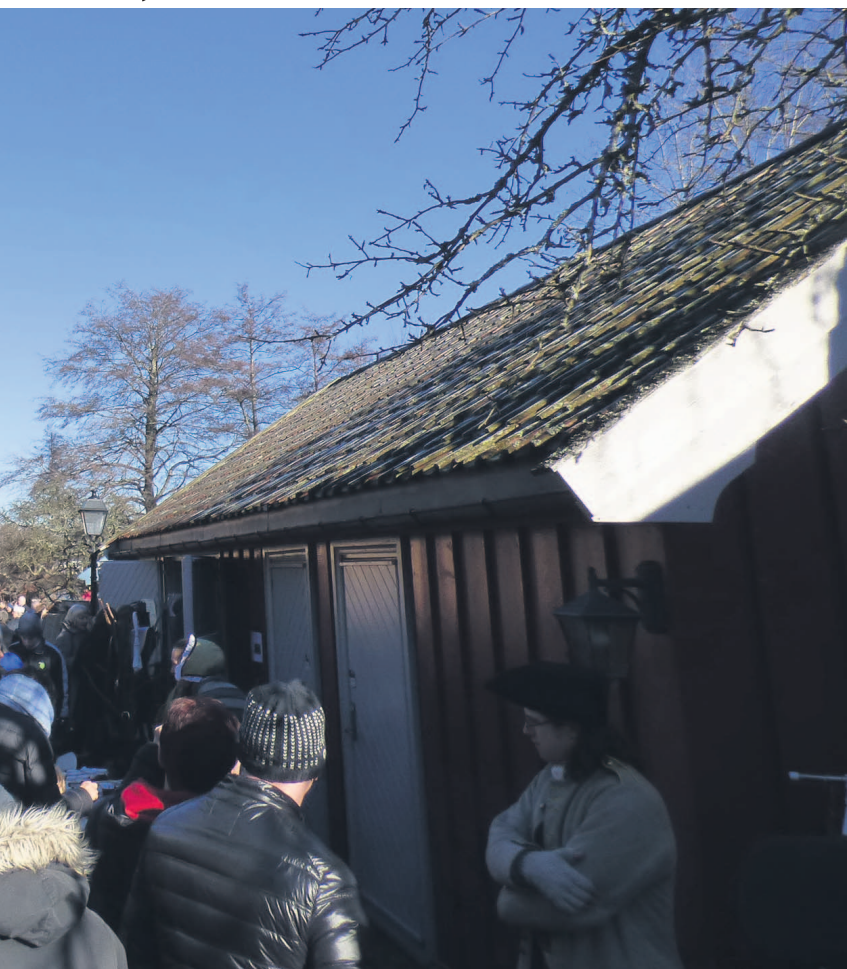
gjorde under Anno-lørdagene tidligere i år.