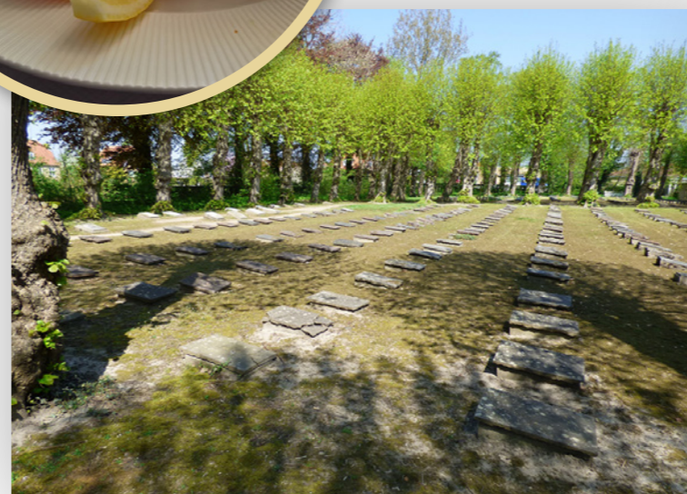
Gudsageren: Den eldste delen av gravplassen "Gudsageren" hvor stenplatene har fått lov til å forvitne gjennom årene.