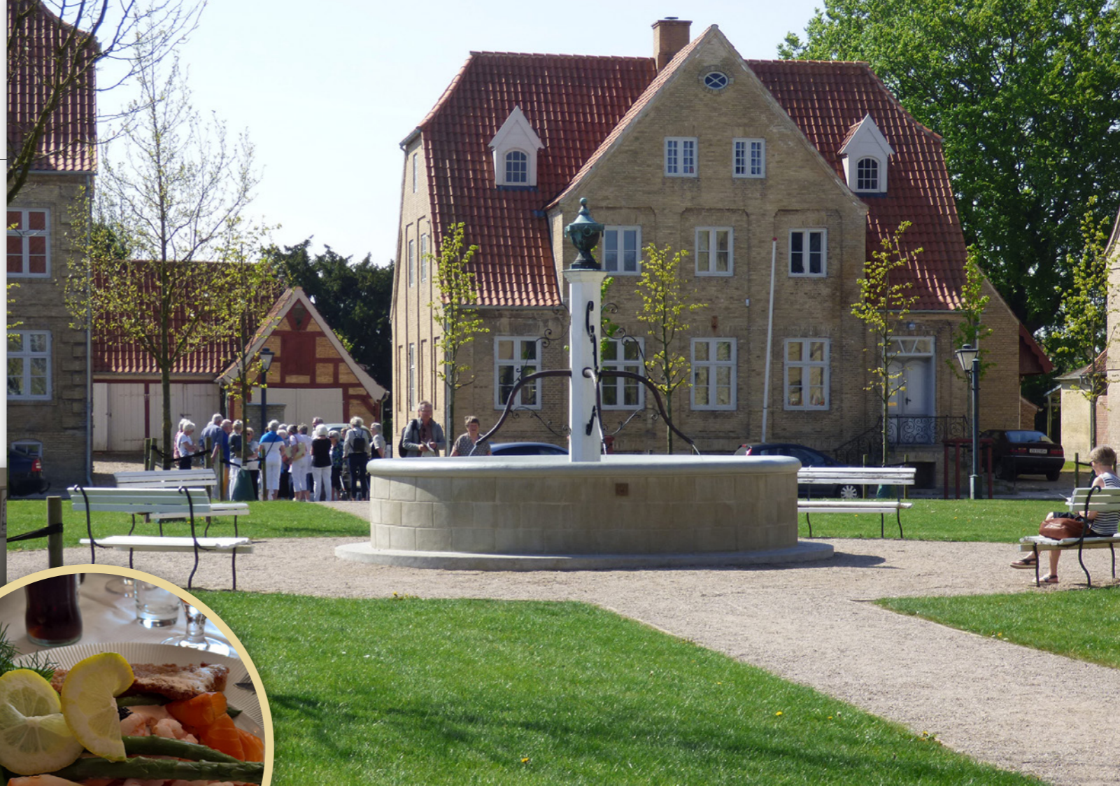
Tegllhus: Husene i Christiansfeld ble utformet etter strikte prinsipper: De skulle bygges av gul Flensborgsten og røde taksten, slik som dette i Lindegade.