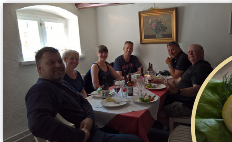
Kongens Kælder: God stemning i "Kongens Kælder" etter at Stjerneskudd-smørbrødene ble servert.

Hun beretter at besøkstallet på senteret har økt fra ca. 8.000