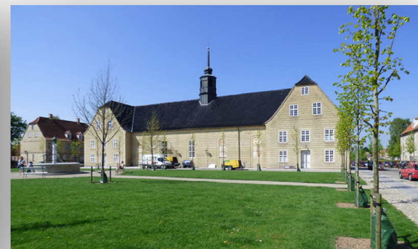
Kirken: I Kirken eller Salhuset finnes det største kirkerommet i Danmark uten bærende søyler, hvor det er plass til 1.000 mennesker på de nøysomme benkene. For øvrig et av de få byggene i byen med sort taksten.