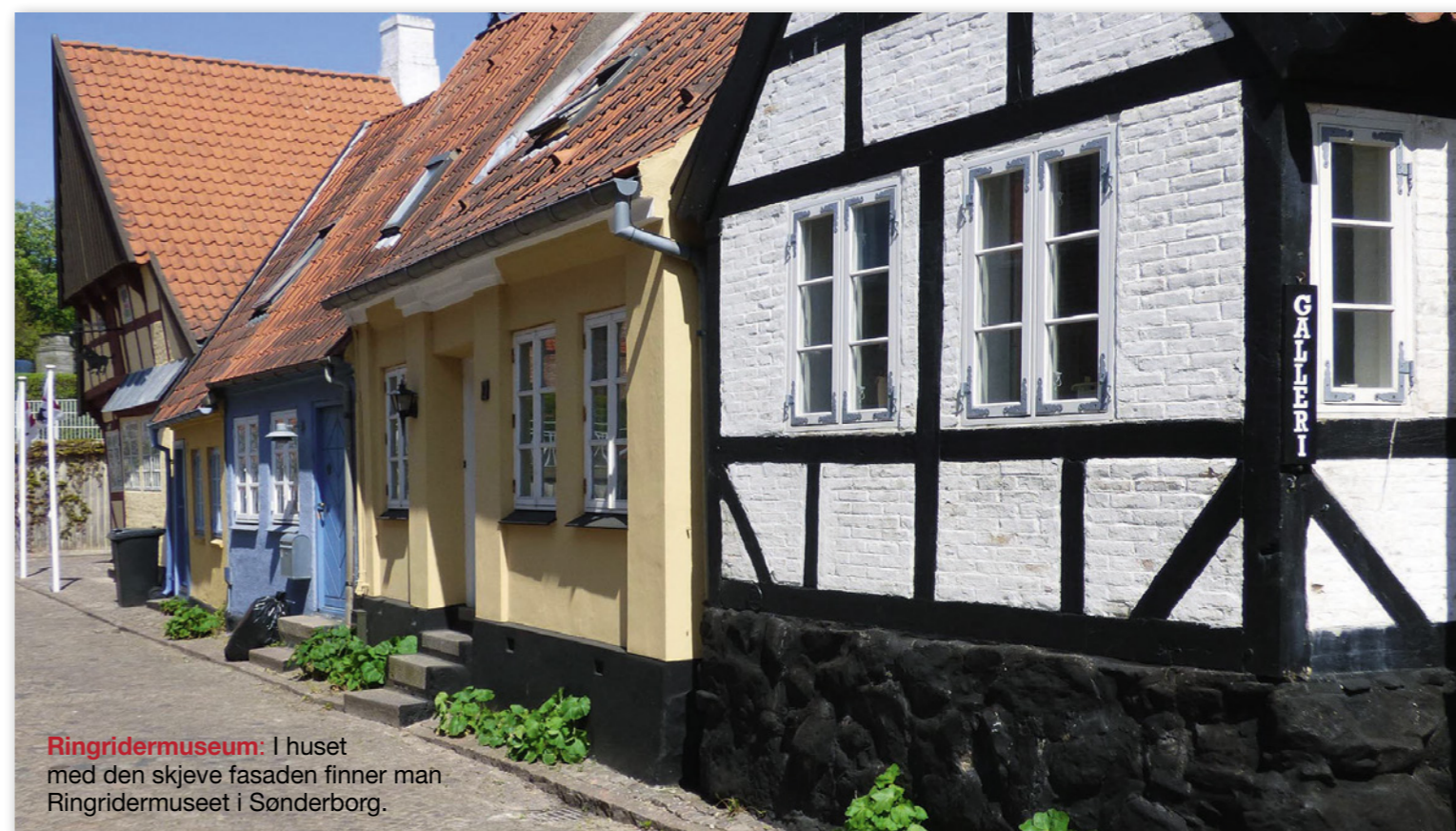
Ringridermuseum: I huset med den skjeve fasaden finner man Ringridermuseet i Sønderborg.