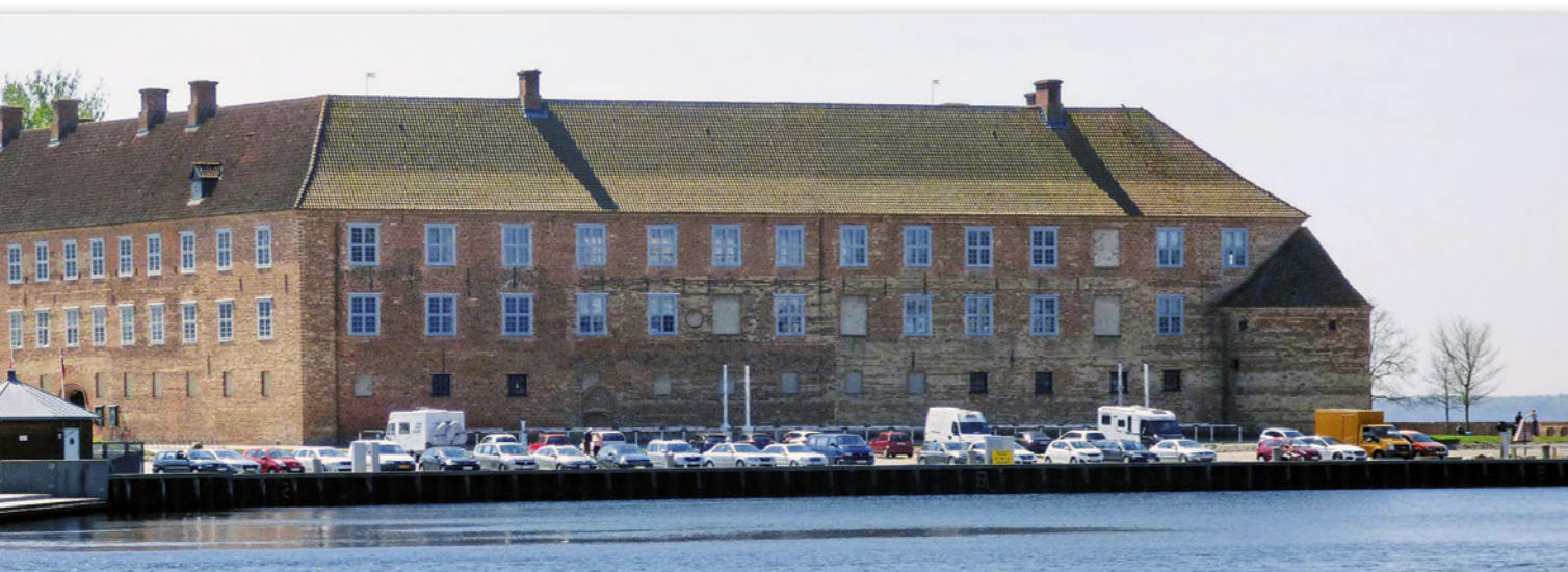
Sønderborg Slot: Slottet har fungert som kaserne for både danske og tyske soldater under skiftende regimer opp gjennom århundrene siden 1100-tallet.

Dette arrangementet har aner fra middelalderen, men festlighetene slik man feirer dem i dag, kom først inn i organiserte former i 1845. Da deltok ca. 450 ryttere som en del av feiringen