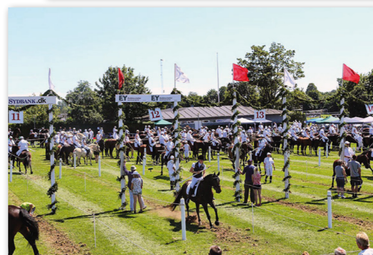
Festivitas: Det er stor festivitas i Sønderborg når ca. 40.000 mennesker overværer Ringriderfesten. (pressefoto)