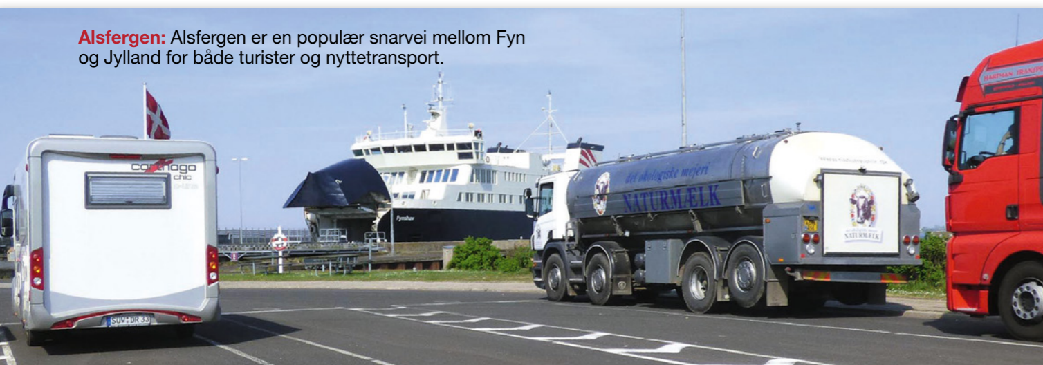
Alsfergen: Alsfergen er en populær snarvei mellom Fyn og Jylland for både turister og nyttetransport.